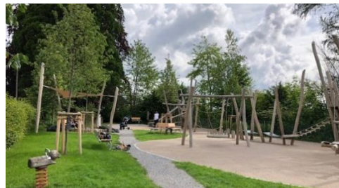
Dornenstrasse ↑ ↗ Klimm