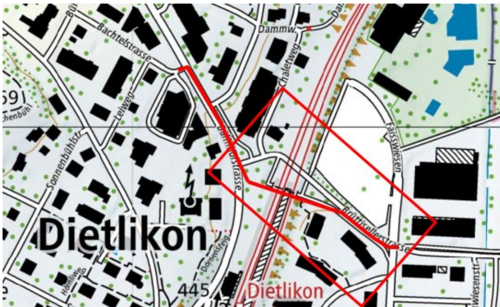
Abbildung 2: Projektperimeter

Als Vorleistung für das SBB-Projekt MehrSpur Zürich-Winterthur muss die Wasserleitung im Bereich der Bahnhof- und Brüttisellerstrasse verlegt werden. Von Januar bis Juni 2026 soll mit einem grabenlosen Vortrieb eine neue Wasserleitung realisiert werden. Der Bahnübergang bleibt während der ganzen Bauzeit gesperrt.