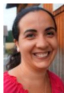
Portugiesisch, Italienisch, Französisch