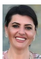
Albanisch, Serbisch, Mazedonisch, Italienisch