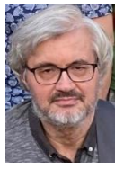
Russisch, Rumänisch, Ukrainisch