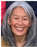
Portugiesisch, Spanisch, Katalan