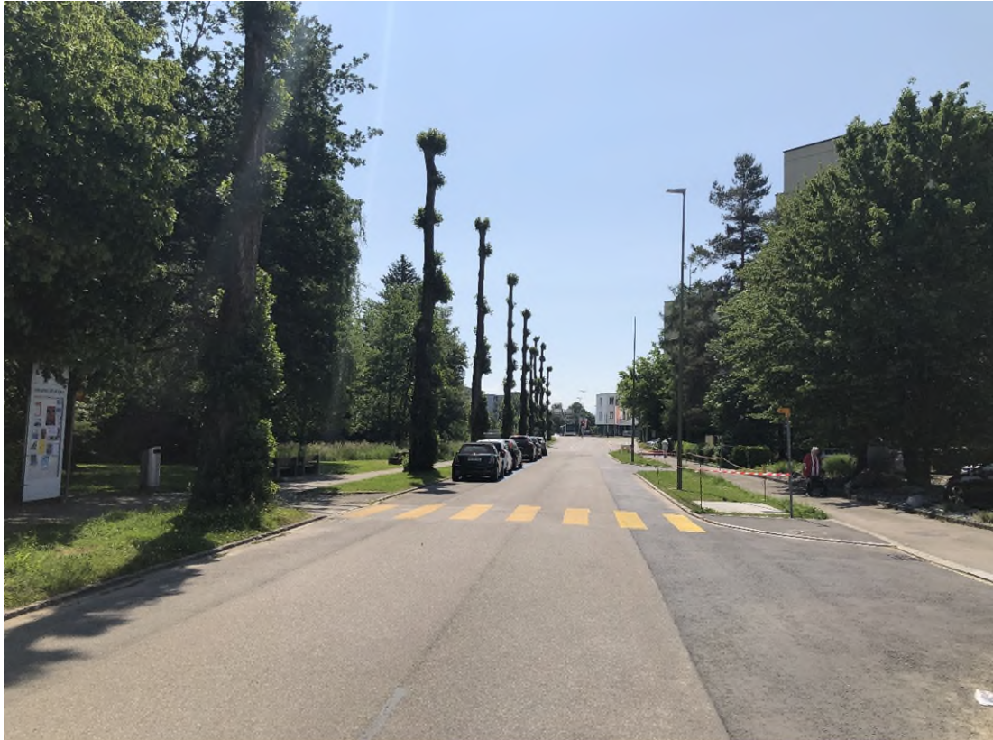
Pappelstrasse in Richtung Neue Winterthurerstrasse