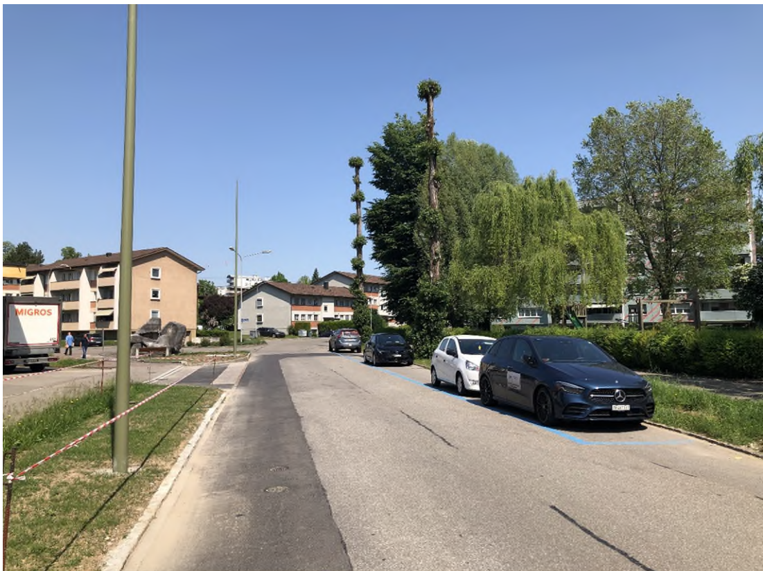
Pappelstrasse in Richtung Knoten Brunnenwiesenstrasse