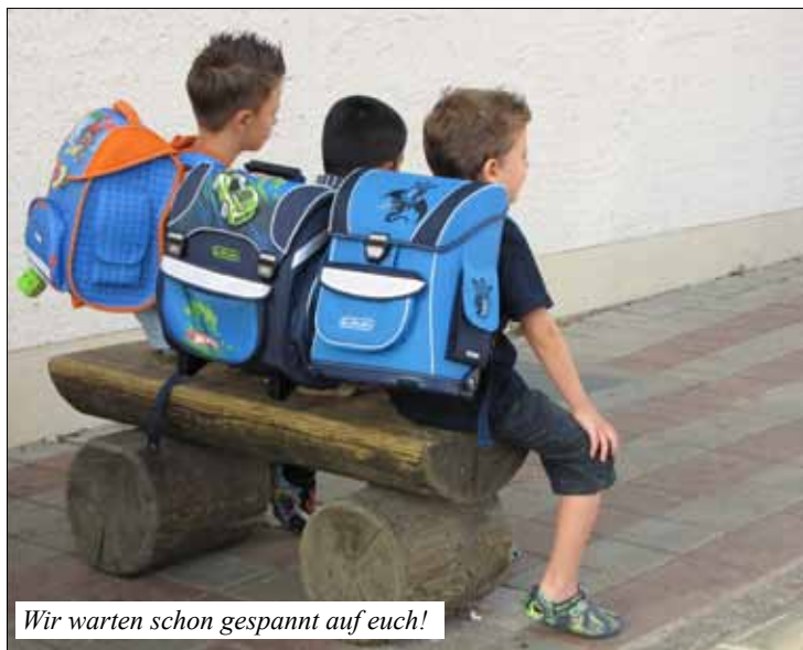
Wir warten schon gespannt auf euch!

Erleben Sie, wie damals als Sie zur Schule gegangen sind, den Schulltag wieder hautnah mit. Sehen Sie, wie aufgeweckte Schüler und Schülerinnen mit motivierten Lehrpersonen einen Schultag gestalten und beobachten Sie das freudige Treiben auf dem Pausenhof. Sie können in der 10-Uhr-Pause dank dem Elternrat Kaffee und Kuchen geniessen.