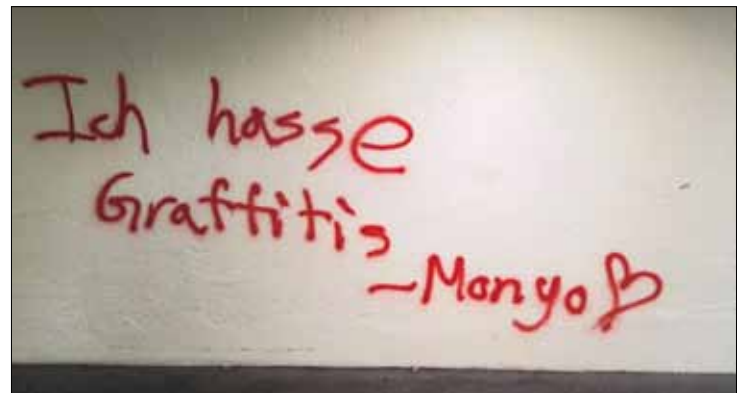
Mai 2016: Schmiererei in der Bahnhofunterführung.