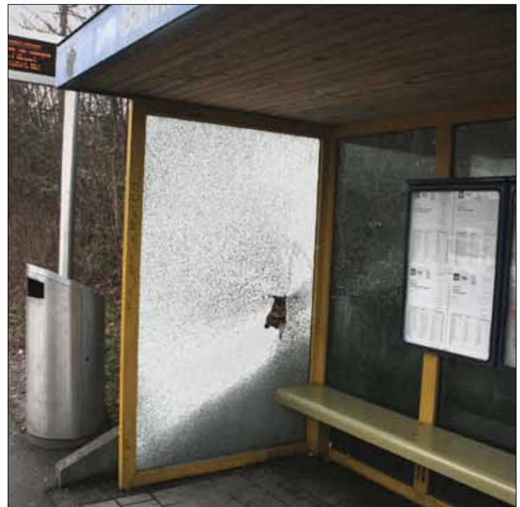
Januar 2016: Bushaltestelle Bahnhof/Bad.