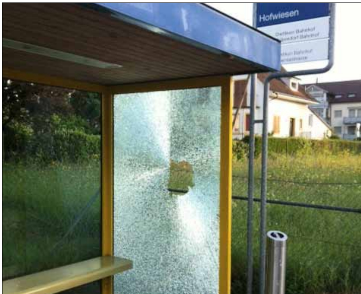
Mai 2016: Bushaltestelle Hofwiesen.

Raum, Umwelt + Verkehr und Unterhaltungsdiens