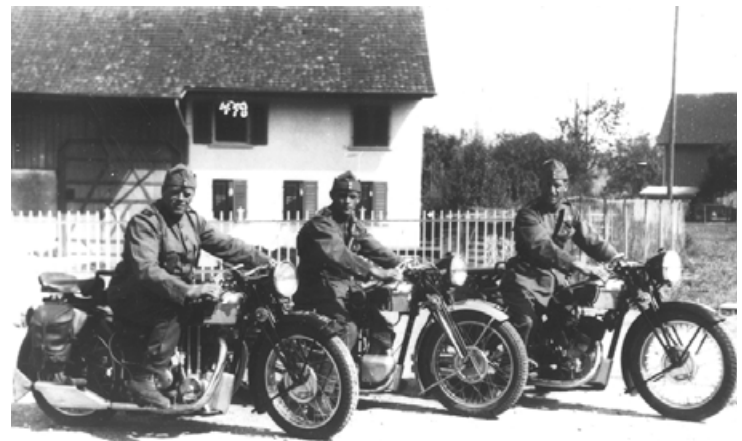
In Dietlikon stationierte Soldaten im 2. Weltkrieg.

Möchten Sie einmal wissen, wie sich die Kirche Dietlikon innert 54 Jahren dreimal stark verändert hat? Was einst dort stand wo Sie heute wohnen oder wie sich Ihr Haus im Lauf der Zeit verändert hat? Wie gross eine Schulklasse vor hundert Jahren war oder wie man früher die Freizeit gestaltet hat? Wie Dietlikon von oben aussah oder wann neue Quartiere entstanden sind? Oder – wenn Sie all dies bereits wissen – einfach wieder einmal in Erinnerungen schwelgen? Kommen Sie auf einen Ausflug in