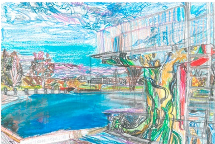
Sprungturm im aqua-life, gezeichnet 2018 von Thierry Bouvard