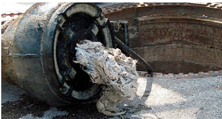
Grosses Problem: Von Müll verstopfte Abwasserpumpen müssen manuell gereinigt werden.

In Toiletten entsorgter Müll verstopft Rohre und Kanäle. Er verfängt sich in den Abwasserpumpen, bildet lange, verfilzte und zähe Stränge, belastet die Pumpen und bringt sie letztendlich zum Stillstand. Nur mit viel Aufwand kommen die Pumpen wieder zum Laufen, denn sie müssen in mühsamer Handarbeit von den Abfallsträngen befreit werden. Eine Arbeit, die sehr kosten- und auch zeitintensiv ist. Es dauert lange, bis das Abwasser wieder fliessen kann.