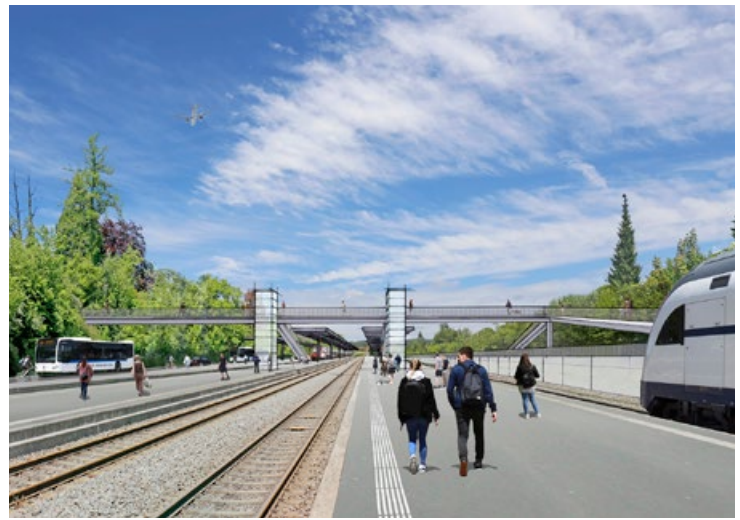
Visualisierung des neuen Bahnhofs Dietlikon.