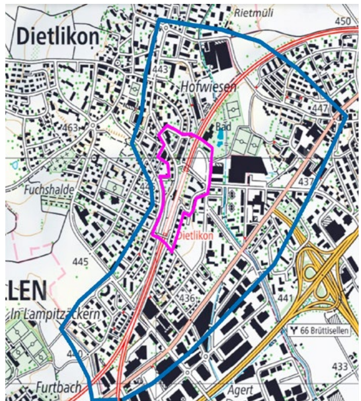
— Innerer Perimeter: Städtebau und Freiräume — Äusserer Perimeter: Verkehrsnetz (MIV, LV, ÖV)

Donnerstag, 13. Dezember 2018, 17.30 Uhr, Alterszentrum Hofwiesen