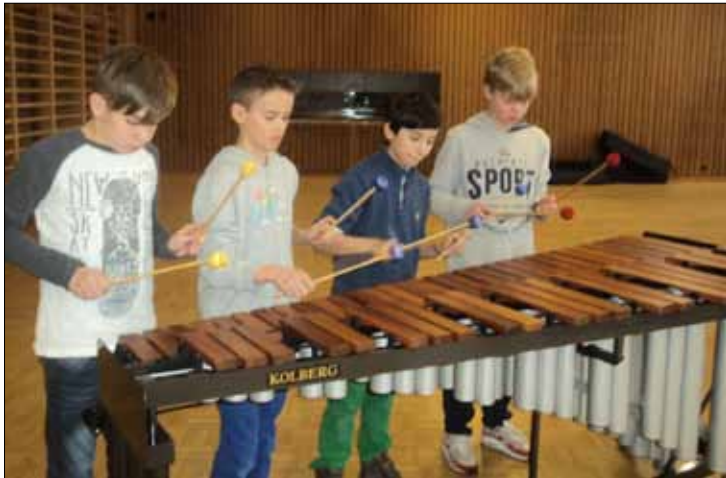
Links: Zu viert am Xylophon.

«Die drei Profis waren super gut, aber das am Schluss mit dem Schreien war einfach genial und sehr laut, aber toll.»