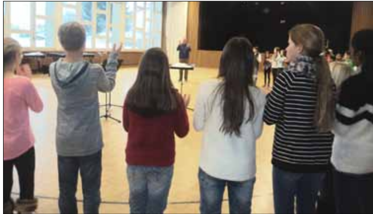
Oben: Einstimmung auf den Musiktag.

«Mir hat gefallen, dass wir überhaupt auf den Musikmorgen gehen durften. Das Tanzen hat mir gefallen, Trommeln spielen war auch gut.»