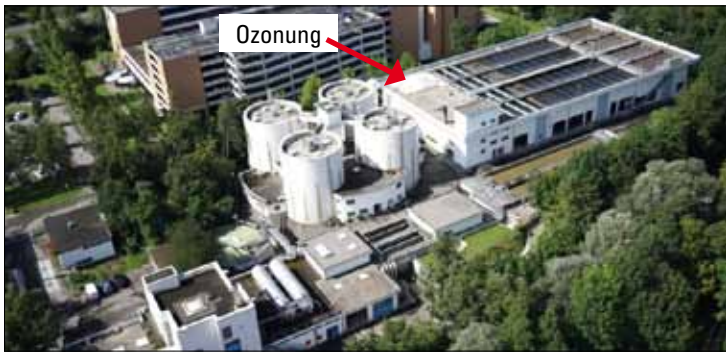
Kläranlage Neugut. Die Ozonung ist im bestehenden Gebäude integriert.

Am 1. Januar 2016 tritt das neue Gewässerschutzgesetz in Kraft. Dies hat zur Folge, dass grosse Kläranlagen und solche an belasteten Gewässern während der nächsten 20 Jahre eine zusätzliche Reinigungsstufe gegen Spurenstoffe einbauen müssen. Das erfordert Investitionen in Milliardenhöhe, verbessert jedoch auch den Schutz der Trinkwasser-Ressourcen. In unserem Abwasser finden sich zahlreiche Mikroverunreinigungen. Darunter Hormone, Kosmetika, Medikamente oder Biozide. Trotz des guten Ausbaustandards der Abwasserreinigungsanlagen belasten diese Substanzen unsere Gewässer. Das neue Gewässerschutzgesetz schreibt deshalb vor, dass bei grossen Kläranlagen sowie bei solchen an besonders belasteten Gewässern technische Massnahmen zur Entfernung von organischen Spurenstoffen umgesetzt werden müssen. Betroffen sind rund 100 der über 700 Kläranlagen in der Schweiz. Darunter auch die