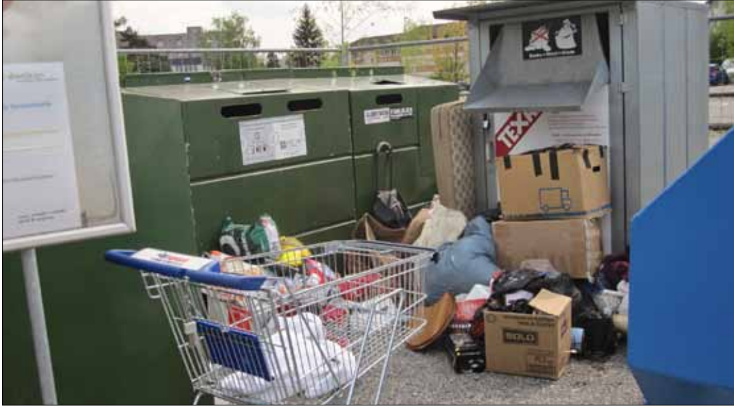
Raum, Umwelt + Verkehr