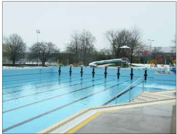
Winterliches Ambiente kurz vor Saisonstart während dem Füllen der Becken!

Das aqua-life Team freut sich auf Ihren Besuch!