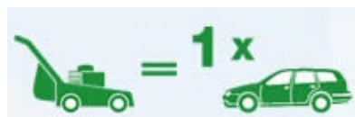
4-Takt-Rasenmäher mit Gerätebenzin

2-Takt-Gartengeräte benötigen als Treibstoff ein Benzin/Ölgemisch. Mit der gebrauchsfertigen Mischung des 2-Takt-Gerätebensins können Sie den Schadstoffausstoss von 100 auf 3 Autos reduzieren.