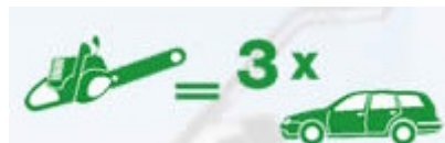
2-Takt-Gerät mit Gerätebenzin