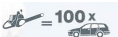
2-Takt-Gerät mit herkömmlichem Benzin

2-Takt-Gartengeräte benötigen als Treibstoff ein Benzin/Ölgemisch. Mit der gebrauchsfertigen Mischung des 2-Takt-Gerätebensins können Sie den Schadstoffausstoss von 100 auf 3 Autos reduzieren.