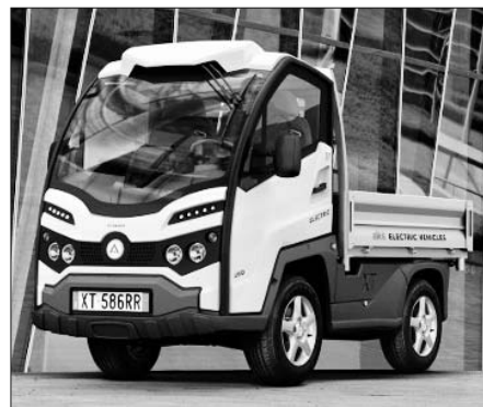
Elektrofahrzeug «ALKE XT».

Bei der Auswahl wurden an der «Gemeinde 2011» mehrere Fahrzeuge besichtigt und geprüft. Als fortschrittliche und zukunftsgerichtete Gemeinde sowie als Trägerin des Energiestadt-Labels beantragte der Unterhaltsdienst, ein Elektro-Fahrzeug der Marke «ALKE» zu kaufen. Der Anschaffungspreis ist gegenüber einem konventionellen Fahrzeug um rund Fr. 10 000 höher. Er wird jedoch durch tiefere Betriebskosten und den ökologischen Mehrwert (= Vorbildfunktion der Gemeinde) mehr als wettgemacht.