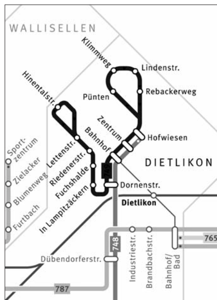
Linienführung Buslinie 749

Wer morgens und abends unterwegs ist, kann